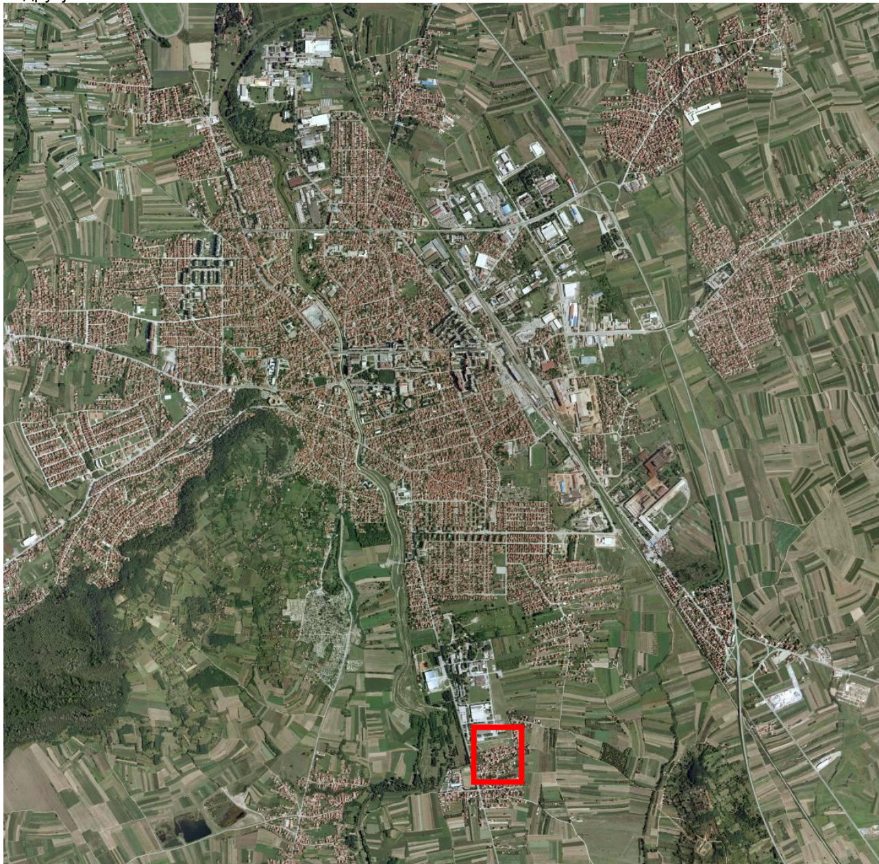
Слика бр. 1: Положај обухвата на орто-фото карти Лесковца

Подручје плана у оквиру свог обухвата је део насеља „Охридско“ у јужном делу града Лесковца, представља део просторно функционалне целине – шире градско подручје.